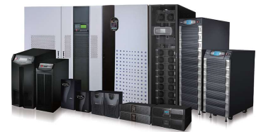
Delta cung cấp đầy đủ các giải pháp UPS từ 600 VA đến 4000 kVA.