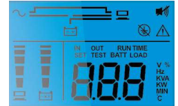
Màn hình LCD

Các đặc tính kỹ thuật có thể thay đổi mà không cần thông báo trước.